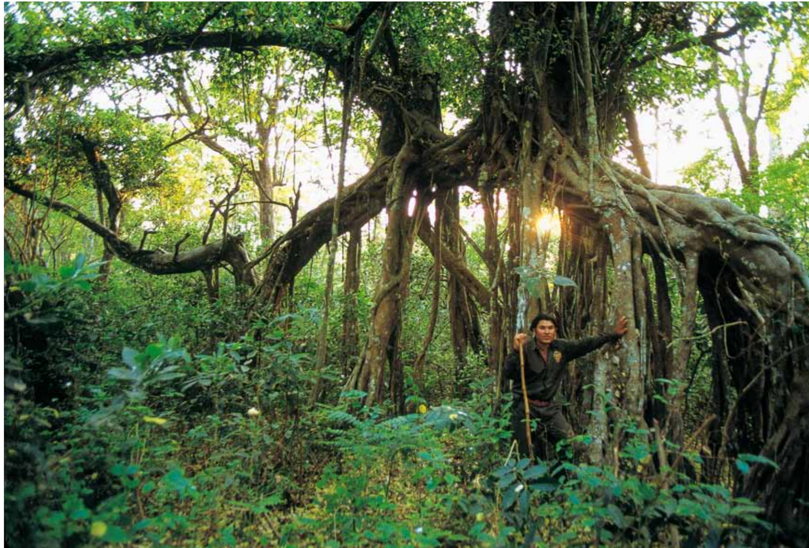
■ Opasjoenvarsimetsässä, jotakomistavatliaanitjakuristajaviikunat. Nekietoutuvatisäntäpuun ympärille syleillen sen hengiltä.

Lapset joella yhdestä valkokapokkipuusta veistetyllä kanootilla (alla).