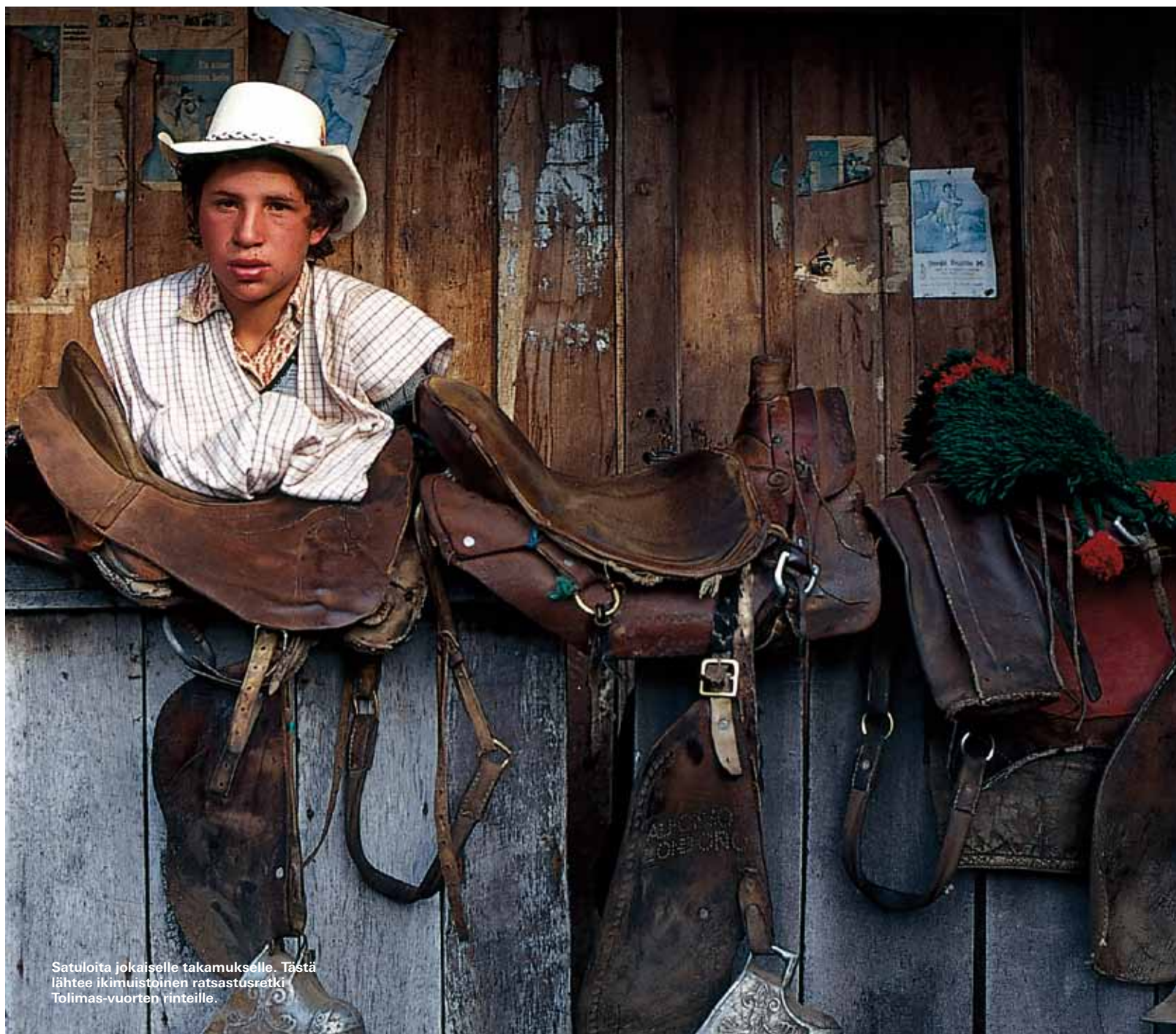
Satuloita jokaiselle takamukselle. Tästä lähtee ikimuistoinen ratsastusretki Tolimas-vuorten rinteille.